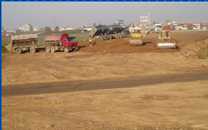
FOTO Z PRŮBĚHU VÝSTAVBY