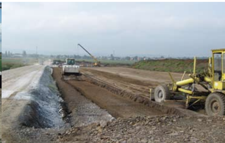
Okružní křižovatka Kateřinky – navážení zeminy do tělesa náspu – 9/2008