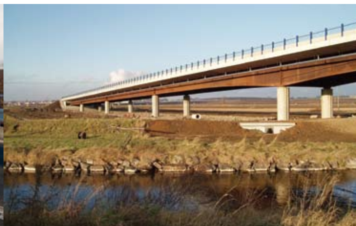
Estakáda na spojce S1 přes řeku Opavu – pohled na trasu z opěry č.1